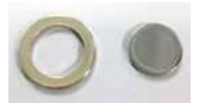
Rohlinge von Ring und Kern