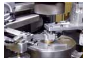
Einlege- und Entnahmegreifer am Prägewerkzeug