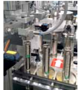
Bimetall-Magazin an der automatischen Zuführung von Ring und Kern.